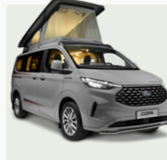
COPA Das durchdachte Multitalent