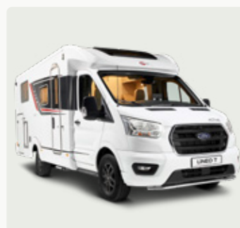
LINEO T Der kompakte Teilintegrierte