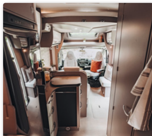
Abbildungen zeigen Harmony Line Paket.

ALLE DETAILS ZUM LYSEO GALLERY TD AUF UNSERER WEBSEITE: