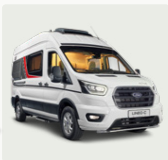
LINEO C Der großzügige Spontane