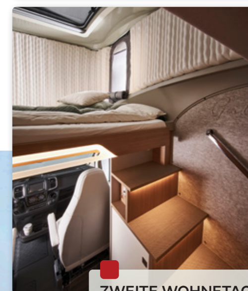
Abbildungen zeigen Harmony Line Paket.