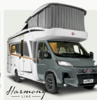
LYSEO GALLERY TD Der innovative Verwandlungskünstler