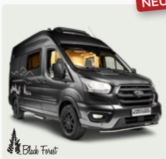
LINEO C 4X4 BLACK FOREST Der großzügige Abenteurer