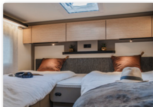
Abbildungen zeigen Attraktive Paket.

ALLE DETAILS ZUM LYSEO TIME SKYLINE AUF UNSERER WEBSEITE: