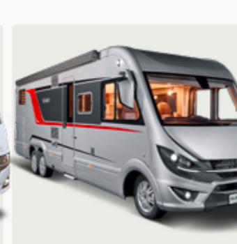
ELEGANCE Das Wohnfühl-Statement