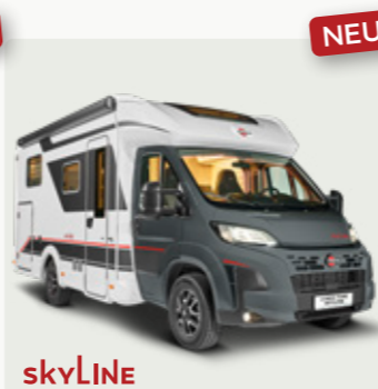
LYSEO TIME SKYLINE Der stylische Teilintegrierte