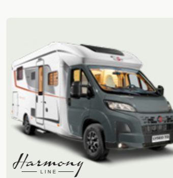
LYSEO TD Das beliebte Raumwunder