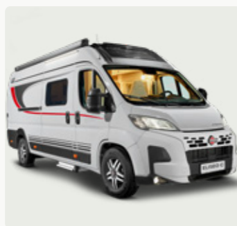
ELISEO C Der Wohnfühl-Campervan