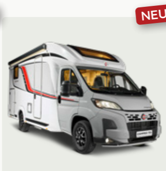
CAMPEO TD Der smarte Allrounder