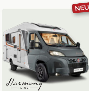
TRAVEL VAN Das wendige Raumwunder