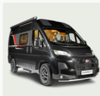
CAMPEO C Der wohnliche Allrounder

Länge: 5,41 – 6,36 m Breite: 2,05 – 2,08 m