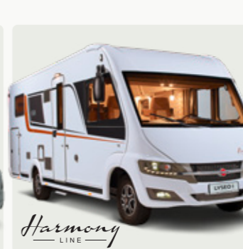
LYSEO I Das beliebte Raumwunder