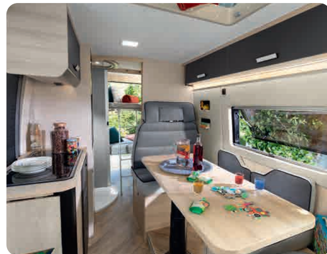
XL-Wohnzimmer, modularer Wohnbereich

EINZIGARTIGER GRUNDRISS 5 Plätze während der Fahrt 5 Plätze beim Essen 5 Plätze zum Schlafen