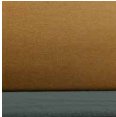
DAFFODIL DOBBY SERIE