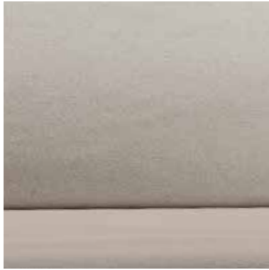
TOFFEE TWEED OPTION