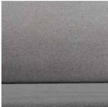
SILVER ASH OPTION