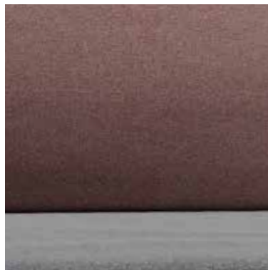
MAUVE DAMASK OPTION